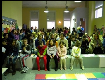
Fray Escoba - Match Solidario